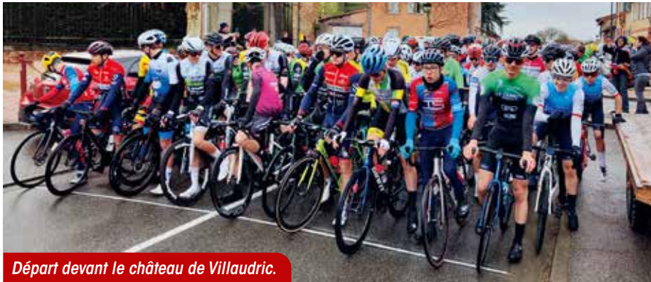
Départ devant le château de Villaudric.

Le 24 février dernier, 140 coureurs ont pris le départ de la course cycliste la Mapei classic du Challenge cycliste Anthony Perez organisé par l'AS Villemur. Pour débiter, les jeunes