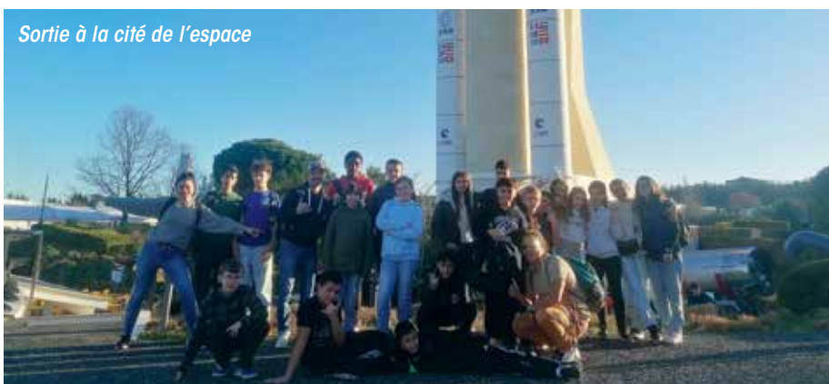
Sortie à la cité de l'espace

Le CAJ est un lieu d'accueil convivial, ouvert à tous, permettant un apprentissage du « vivre ensemble », une ouverture culturelle et un développement de la curiosité, encadré par une équipe d'animation dynamique. Il permet également aux jeunes de participer à des activités sportives, musicales ou artistiques selon un programme varié, créatif et modulable.