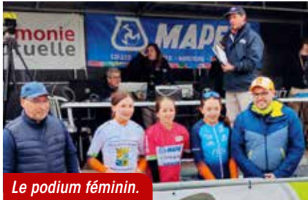
Le podium féminin.